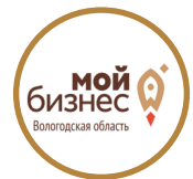
Центр «Мой бизнес»

Предоставляет льготные займы, реализует нац. проект «Производительность труда»