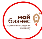
Центр гарантийного обеспечения МСП

Предоставляет микрозаймы для «самозанятых», планирующих начать работу субъектов МСП и действующего бизнеса