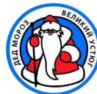
АО «Дед Мороз»

Предоставляет поручительства для «самозанятых», планирующих начать работу субъектов МСП и действующего бизнеса