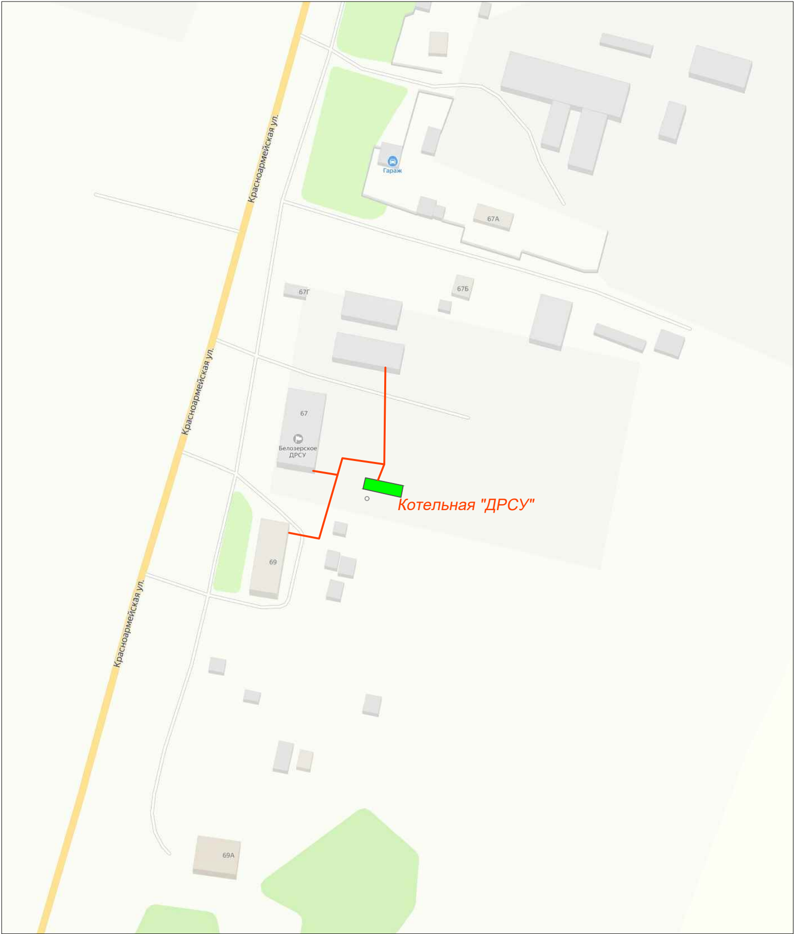
Схема теплоснабжения котельной "ДРСУ", фрагмент территории М1:2000