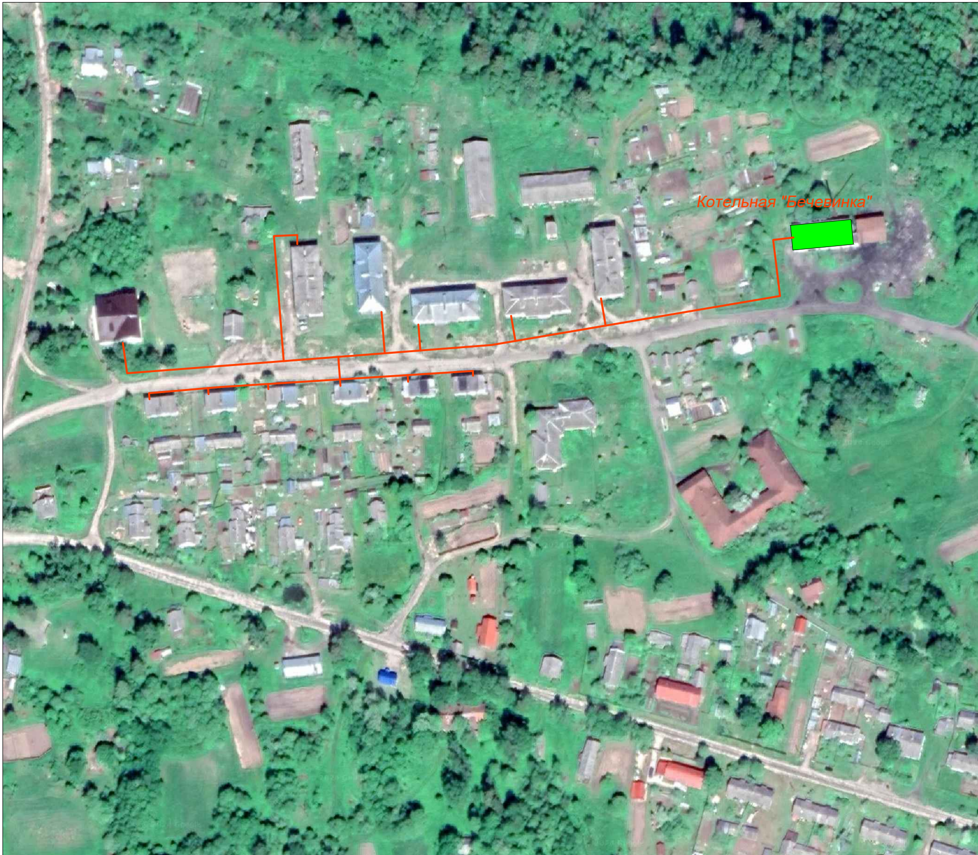
Схема теплоснабжения котельной "Бечевинка", фрагмент территории М1:2000