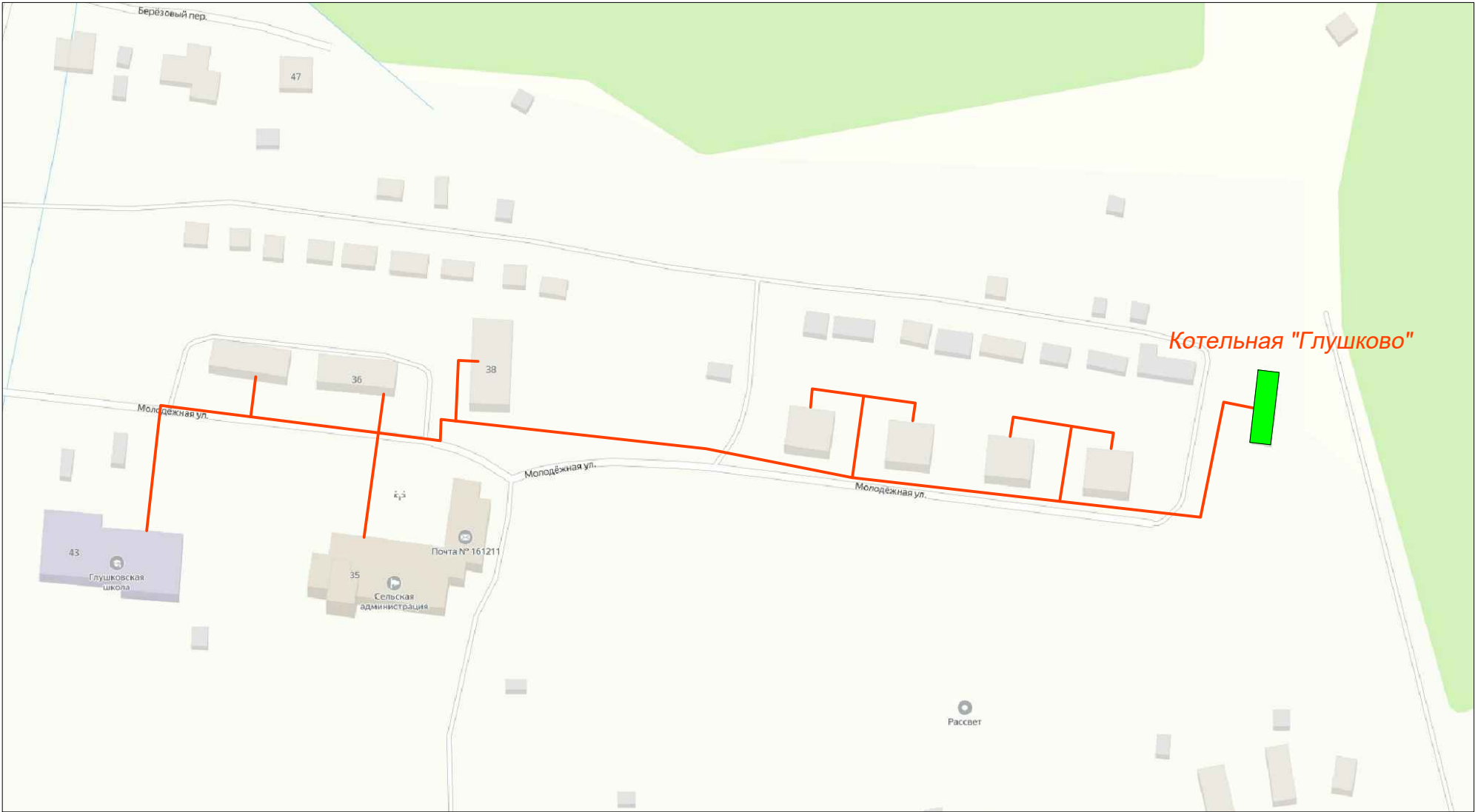
Схема теплоснабжения котельной "Глушково", фрагмент территории М1:2000